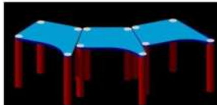
Il "Banco 3.3" in una simulazione di gruppo